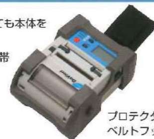
プロテクター、 ベルトフック装着時

120センチの高さから落下しても本体を守るプロテクター。携帯に便利なベルトフック、携帯ホルスター、補助ケースなど用途に合わせてオプションをお選び下さい。