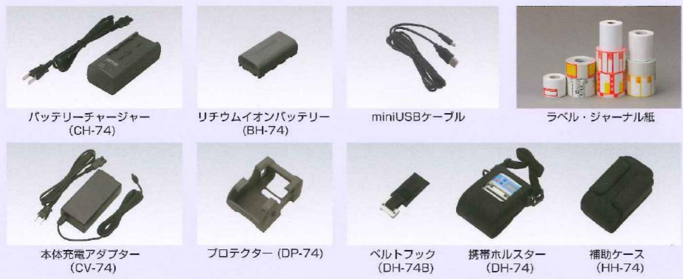
バッテリーチャージャー (CH-74)